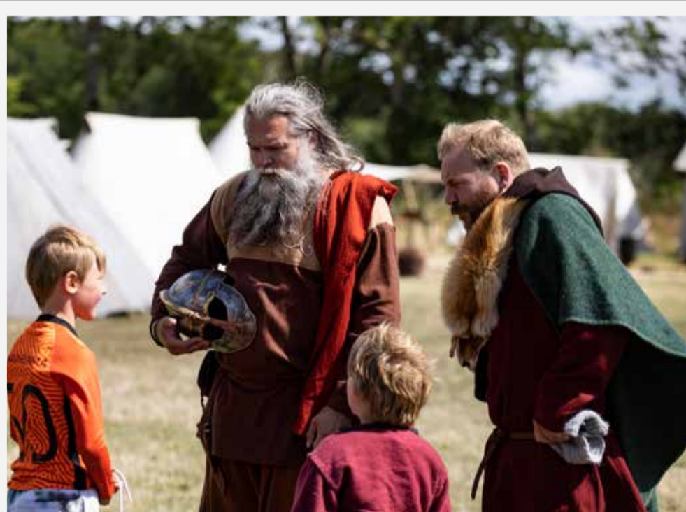
VIKINGEOMRÅDET & KONGEHALLEN