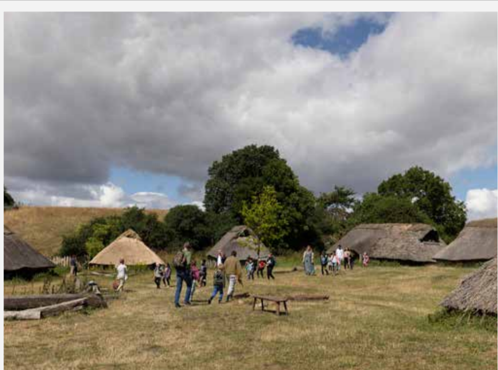
JERNALDERBYEN LETHRA & OFFERMOSEN