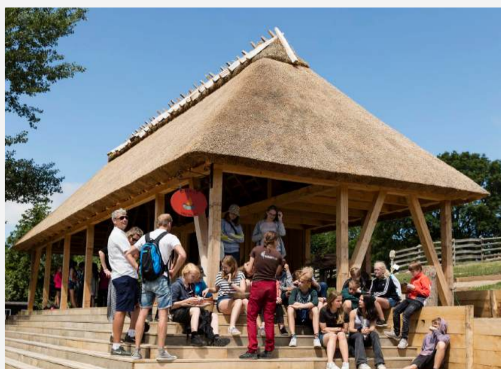
UNDERVISNING I BÅLDALEN