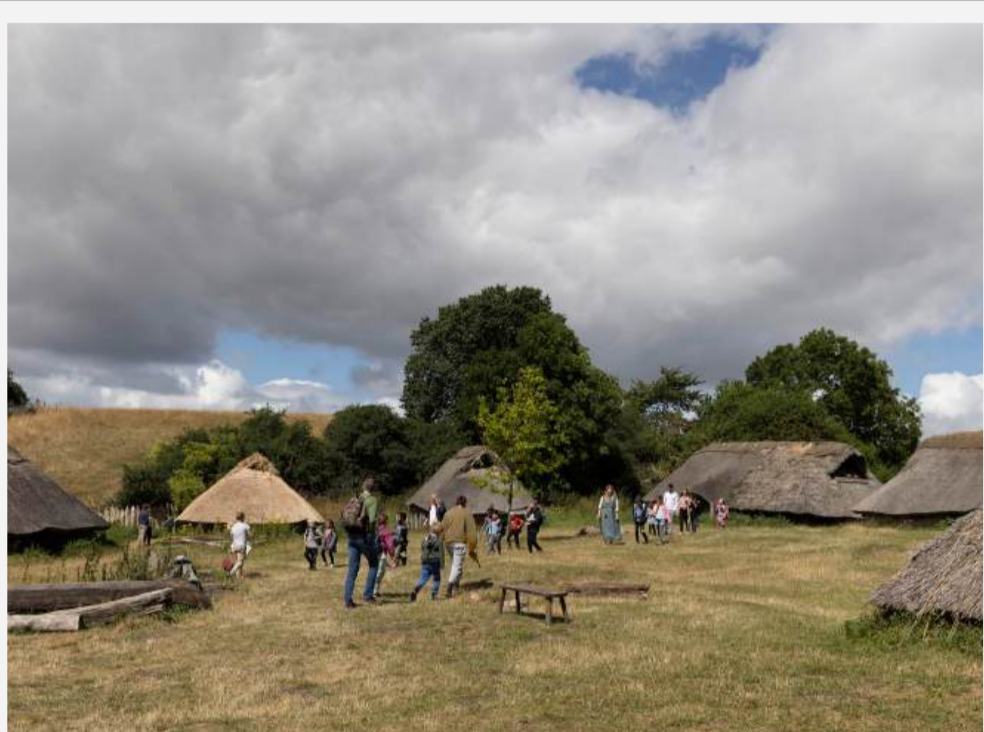
JERNALDERBYEN LETHRA & OFFERMOSEN