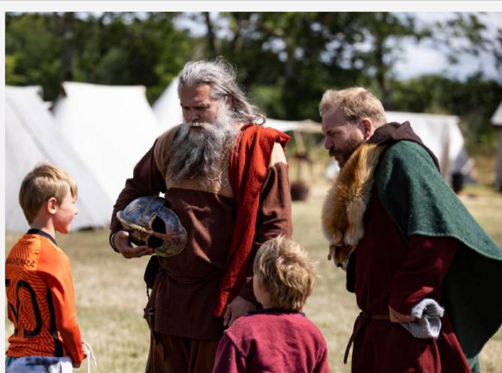
VIKINGEOMRÅDET & KONGEHALLEN