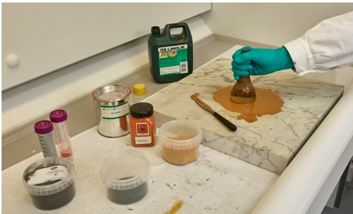
Fig. 3. Pigmentet okker rives i rå linolie og blandes sidenhen med kogt linolie til maling.

Herefter er malingen opstrøget på karton, til brugbare farvekort. Linoliemaling er ved opstrygning forholdsvis blank, dog afhængig af pigmentets beskaffenhed. Malingen vil med tiden blive mere og mere mat.