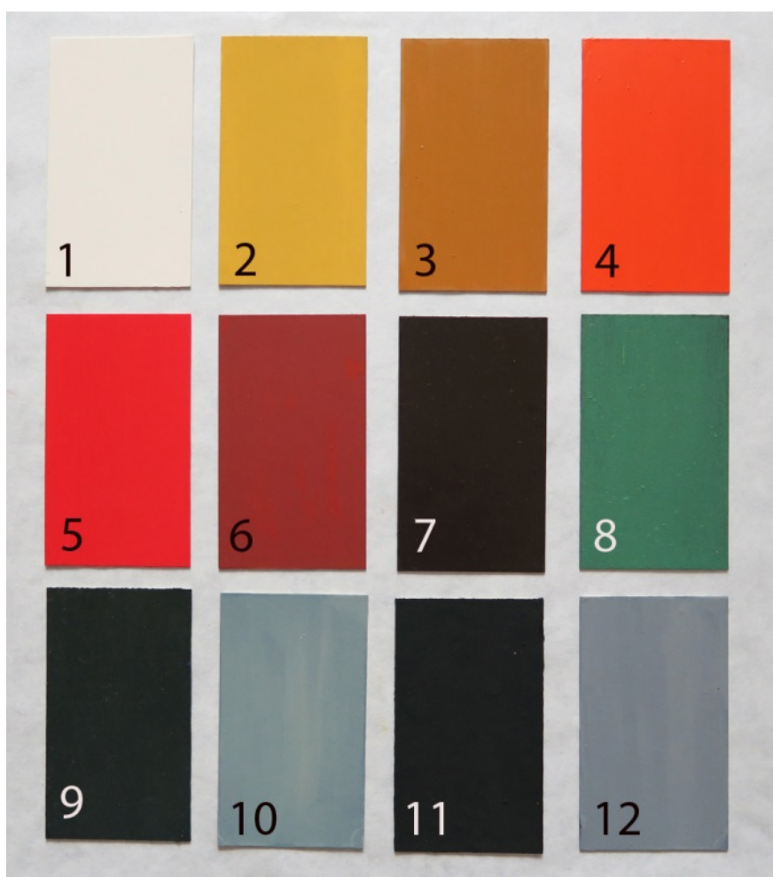
Fig. 5. Vikingetidspaletten, nummereret i henhold til nedenstående beskrivelse.

Til hjælp ved valg af, hvilke kulører man skal bruge hvor, hvilke der kan bruges i større mængder, og hvilke der kun skal bruges til ornamentter, har vi angivet, hvor dyre eller billige vi mener, pigmenterne var.