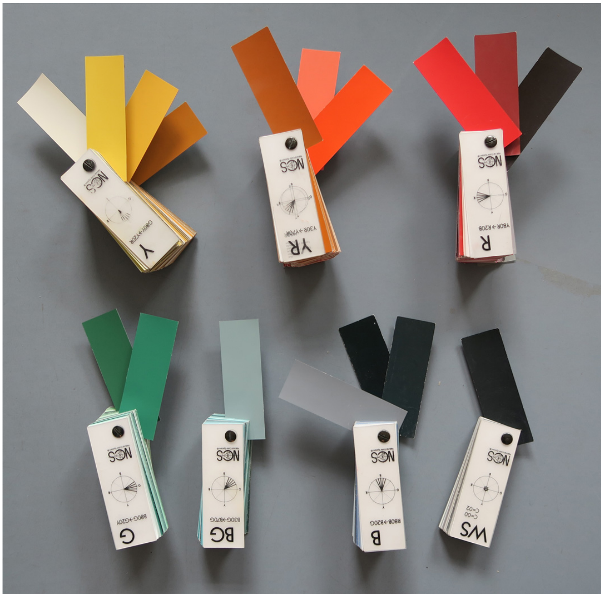
Fig. 6. Vikingetidspaletten vist i NCS-farvekort.