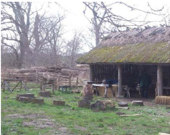
Som altid er der brug for brænde – og for at det ligger pænt