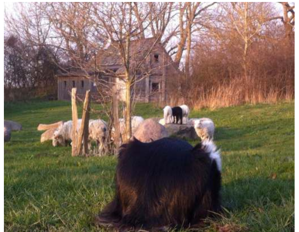
Fårehunden Deva (den sorte bunke i forgrunden) - ansat i Sagnlandet. Vogter Skudde får ved lejrskolehusene

Gute fåret er den største flok af får på 38 avlsdyr, der i år vil vokse betragteligt, da der netop er skiftet avlsvædder. Det stammer fra Gotland og har en uldtype, der ligner uld fundet i bronze alderen. Både hanner og hunner har horn, og ligesom skudderne har de 2 lags uld. De kommer i både grålig, sort og hvid med enkelte brune nuancer og vil i løbet af året skifte farven i ansigtet, så der bliver mørkere hen mod vinteren. De er et forsøg på at bevare de historiske genresoucer i Skandinavien. Det er en lidt større race end skudderne (får ca. 40Kg og væddere ca. 60kg). Deres avlsvædder Frodo, der iøvrigt har været på TV2, bliver brugt til formidling af får, da han godt kan håndtere at blive plukket og hevet i af publikum, hvis bare der er æbler i nærheden. Det er også med gutterne, den primære formidling af uld vil foregå ved vævestuen.