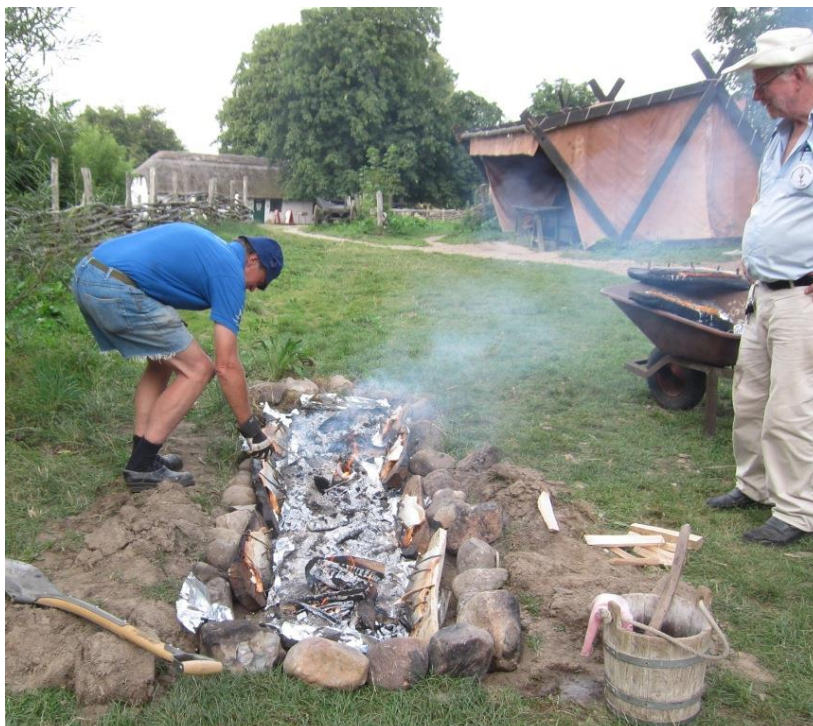
Plankelaks i midlertidigt tørvej - årsfesten 2013

Læs mere på Sagnlandets hjemmeside www.sagnlandet.dk . Hvis I ikke allerede abonnerer på nyhedsbrevet, kan I tilmelde Jer på http://www.sagnlandet.dk/Nyhedsbrev-fra-Sagnlandet-Lejre.1168.0.html