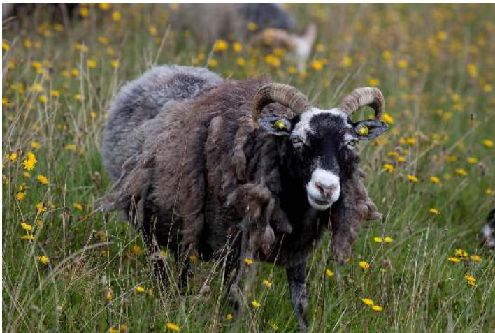
Vædderen Frodo – en vældig gute – på overdrevet ved Jernalderen

I Sagnlandet findes der to racer af får, Skudde fåret og Gute fåret. Skudde fåret findes i 3 farver. Hos os findes de i hvid og sort. Alle skudder' bærer også den røde farve, så hvem ved, om vi en dag får dem alle 3. Skudde fåret kan dateres tilbage til bronzealderen og er en lille race (får ca. 25kg og væddere 40kg). Deres uld er to-lags med fine underulds fibre med tyk stift overuld, fyldt med "dødhår". Dødhår er hule hår, der holder ulden luftig og oprejst. De er typisk en lidt mere flygtig race, der sjældent bliver helt tamme. De går til dagligt oppe hos vikingerne ved Ravnebjerg primært pga. fund af fibre ved Hedeby og deres jernalder historie. Flokken består af 10 stk. 2 avlsvæddere hvor den ene er kastreret, 3 voksne avlsfår og 5 lam, hvoraf de 3 vil indgå i flokken, da den nye avlsvædder ikke er i familie med dem. Deres uld vil i 2014 blive testet i forskellige materialer i vævestuen.