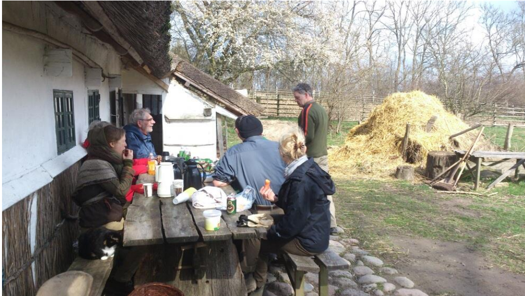
En hyggelig pause i arbejdet