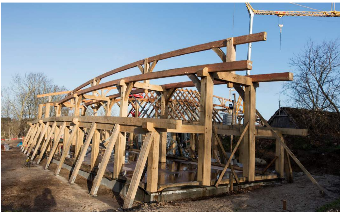
MODULER SET FRA MODSATTE SIDE.